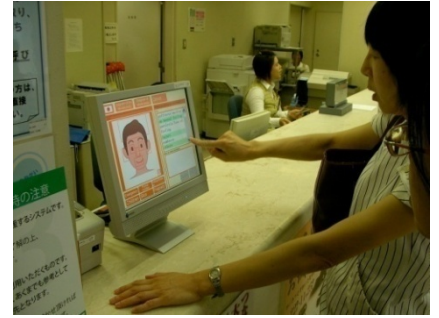
京都市立病院におけるM 3 利用の様子

現在、京都市立病院に多言語医療受付支援システムM 3 （エムキューブ）を導入し、用例対訳を用いた多言語対話の支援を行っています。M 3 は用例対訳を用いた受付支援機能を提供しており、病院の受付を母語で行うことができます。